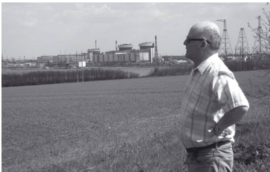
Elektrownia atomowa w Jużnoukraińsku

Aby dotrzeć w te odległe strony wybrałem pociąg, najpewniejszy środek lokomocji w takich podróżach. Codziennie rano z Dworca Centralnego w Warszawie odjeżdża do Przemyśla pociąg, który w zestawie mam jeden ukraiński wagon, ze stacją docelową Odessa. Byłem w nim jednym z nielicznych pasażerów, lecz miła ukraińska obsługa zapewniała pewien komfort i bezpieczeństwo długich godzin podróży. Wagon jest doczepiany