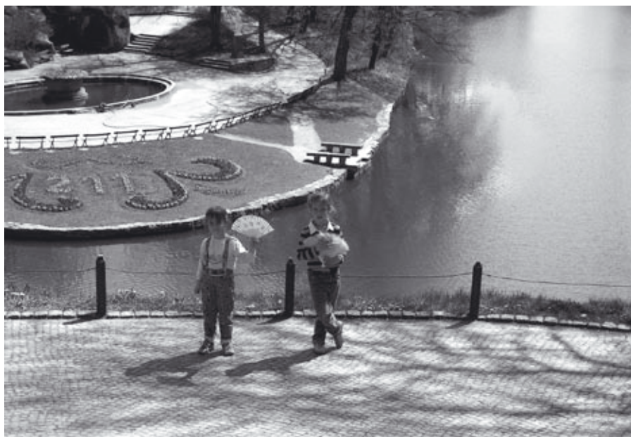
Park Zofiówka. Specjalny gazon przypomina o rocznicy założenia tego parku