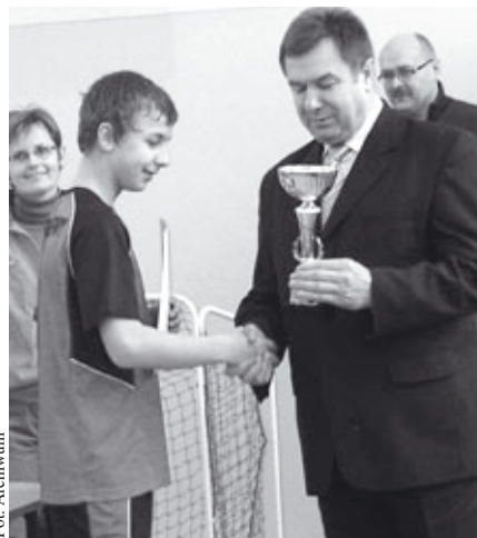
Sala sportowa SP Kozięglowy przez dwa dni pełna była unihokeja

Turniej rozgrywany był w sali przy Szkole Podstawowej w Kozięglowach. Pierwszego dnia rywalizowały dziewczę-