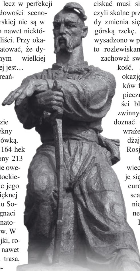
Targowica. Posępny Kozak przypomina o dawnych dziejach...